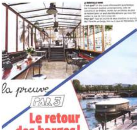
LA NOUVELLE SEINE C'est quoi ? Un lieu d'innovation artistique qui réunit un bar, un restaurant, un théâtre et un cabaret burlesque. Un lieu de création en face de Notre-Dame, quel rêve ! Cet endroit est magique, baigné de lumière et d'ondes positives. Un nouveau lieu de création en face de Notre-Dame, quel rêve ! Cet endroit est magique, baigné de lumière et d'ondes positives.

» Un festival ? « Du théâtre et de l'humour jusqu'au 28 septembre, pour lancer notre première saison culturelle. Quelques noms : Didier Super, Ali Bougheraba, Mathieu Madénian, Thomas VDB, Kheiron, Audrey Vernon... » ■ M.C. 3, quai de Montebello, 5 e . Tél. : 01 43 54 09 08.